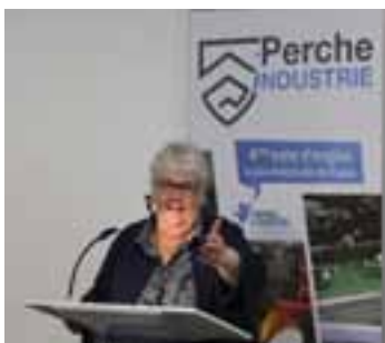
P.4 Territoires d'Industrie : une signature de ministre

Renforcement des services à la population !