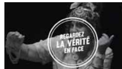
Quatre vidéos sur la page Facebook : @c'est dans le perche que ça se passe !

« Essayer le Perche, c'est l'adopter ! Je le constate dans les événements comme le salon du tourisme de Nantes, celui de l'agriculture à Paris ou encore le Chefs World summit de Monaco. Les visiteurs nous découvrent, traversent la France pour nous rendre visite et... reviennent ! C'est capital de promouvoir notre territoire avec tous ses acteurs. Unis, nous sommes efficaces ! »