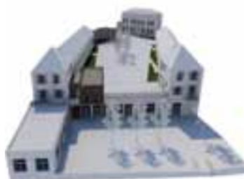
P.6 Le plan de rénovation des écoles en action