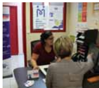
P.7 La Maison de Service Au Public en plein essor