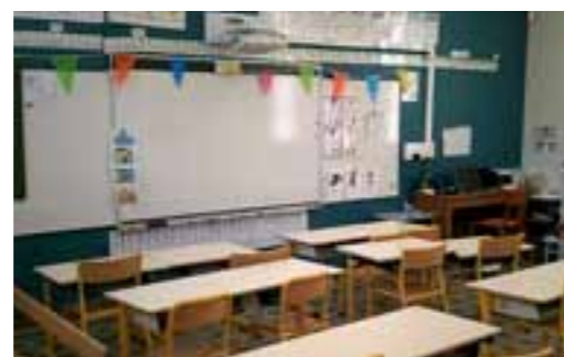
Les tableaux VPI équipent toutes les écoles comme celle de La Rouge