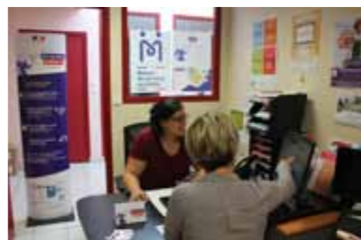
Les services les plus demandés à la MSAP sont ceux de la CAF et de la carte grise

Des classes découvertes ont été organisées à Saint-Léonard-des-Bois par l'école de Mâle ou sur les plages du Débarquement pour celle de Bellême, afin d'ouvrir les enfants à de nouveaux apprentissages. La poursuite des TAP (Temps d'Activité Périscolaire) dans toutes les écoles, exceptée Saint-Germain-de-la-Coudre, revenue à la semaine de quatre jours, amplifie cette dynamique en proposant aux élèves de nouvelles activités sportives, culturelles, manuelles en maternelle et en primaire, avec trente activités proposées par trente-cinq intervenants.