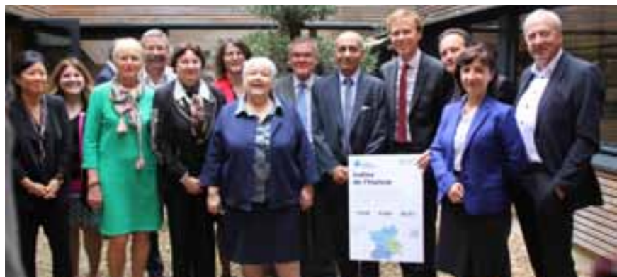
Signature du protocole Territoires d'Industrie avec Jacqueline Gourault la ministre de la Cohésion du territoire

Ses élus ont été reçus par le Premier ministre, Edouard Philippe, à l'hôtel Matignon, en mars. Jacqueline Gourault, ministre de la Cohésion du territoire et des Relations avec les Collectivités territoriales, est venue signer le protocole de Territoire d'Industrie avec tous les acteurs, en mai, dans les locaux de l'entreprise Linvest, à Berd'huis.