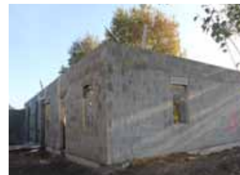
Le pôle santé de Val-au-Perche en construction - Livraison à l'été 2020